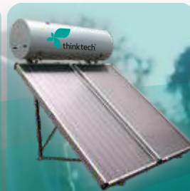
THK TUS 302 -2 coletores THK 200 -1 Acumulador de 200L - Acessórios e estrutura em alumínio