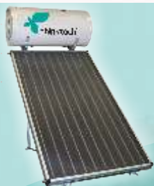
THK TUS 151 -1 coletor THK 200 -1 Acumulador de 150L - Acessórios e estrutura em alumínio