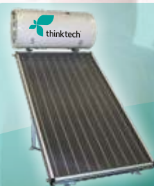
THK TUS 201 -1 coletor THK 250 -1 Acumulador de 200L - Acessórios e estrutura em alumínio